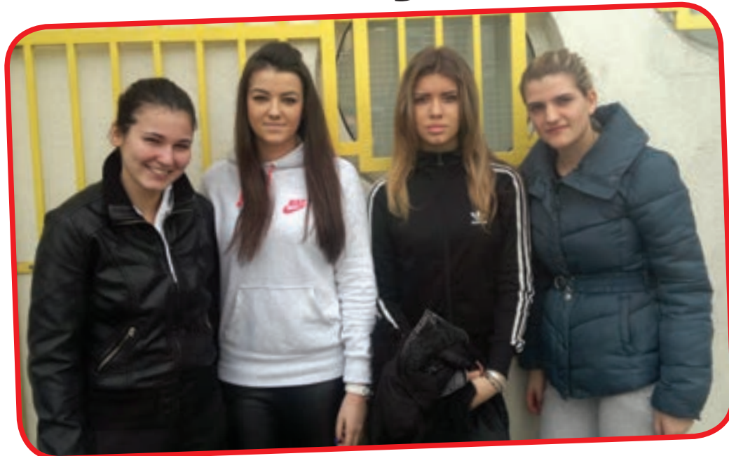
Stolnotenisačice naše škole