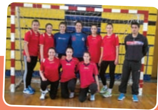
Rukometašice su bile bez konkurencije

U samoj završnici natjecanja naša je škola pobijedila