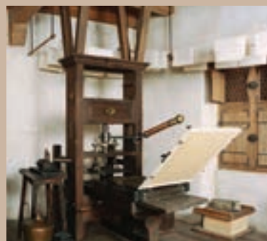
Gutenbergov tiskarski stroj

Inače se smatra da su Kinezi prvi izumili pokretna slova od kojih su pisali riječi. To se otkriće pripisuje Pi Šengu u razdoblju oko tisućitih godina poslije Krista. Odatle se princip tiskanja proširio u Koreju i Japan.