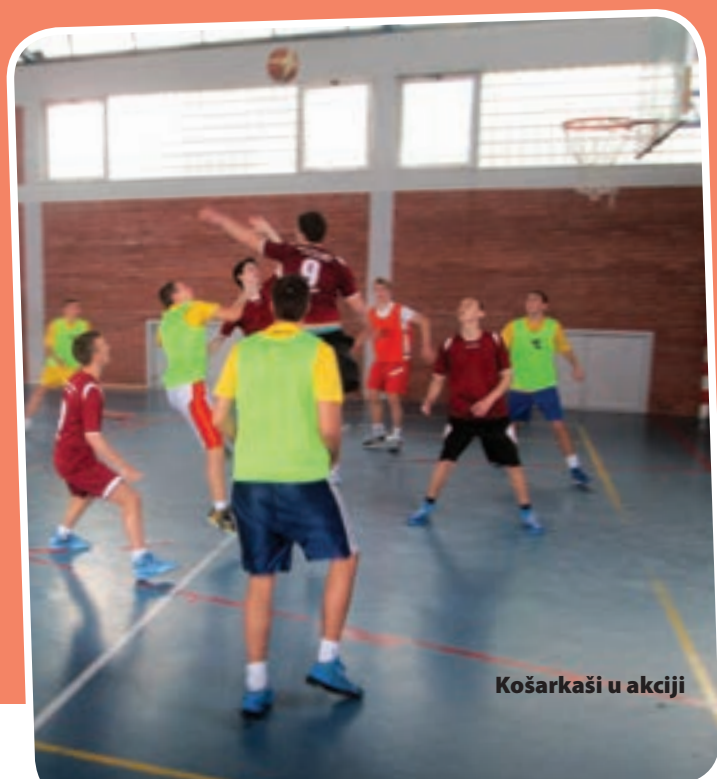
Košarkaši u akciji

U ukupnom poretku ovogodišnjeg prvenstva u nogometu zauzeli smo 3. mjesto, iza prvoplasirane Prometne i drugoplasirane Mašinsko-saobraćajne.