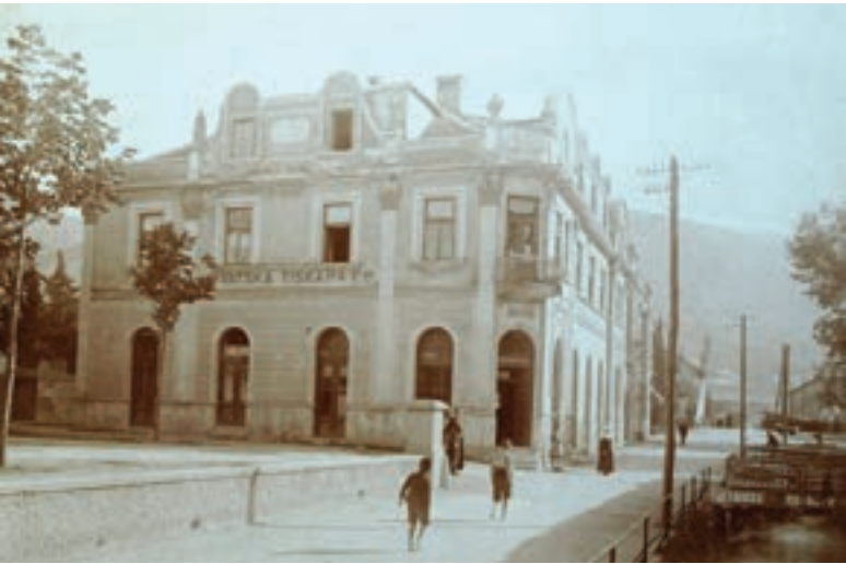
Prva hrvatska tiskara nalazila se u Franjevačkoj ulici

Ne sjećamo se kada smo prvi put uzeli knjigu u ruku, čak ni naslova prve knjige koju smo pročitali. Rijetki su se zapitali odakle sve te silne knjige i časopisi u našim knjižarama, knjižnicama, na našim kioscima... Obično ih uzimamo zdravo za gotovo. Čitajući lekturu U registraturi , osjećajući težinu te nemale knjige u ruci, zapitale smo se kako je zapravo nastala. Znamo, napisao ju je Ante Kovačić, ali što dalje... Odlučile smo istražiti povijest tiskarstva u našem gradu i otkrile koliko zapravo ne znamo o tiskanju knjiga.