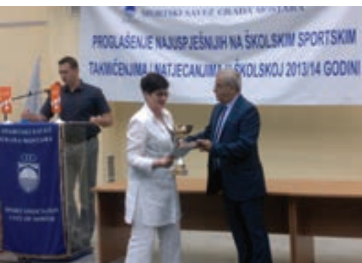
Naša je škola ponovno najuspješnija u sportu